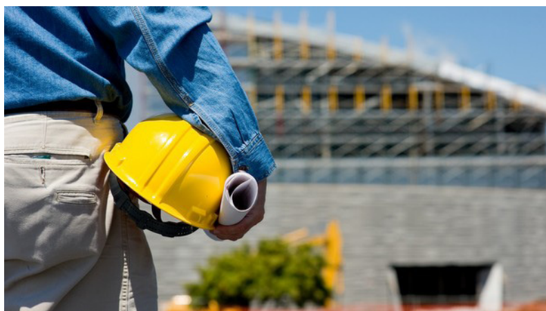
Bezrobotny członek kasy bezrobocia (a-kasse) otrzymuje pieniądze (dagpenge)

Pewna część organizacji związkowych w tym Zrzeszenie Zawodowców Budowlanych w Kopenhadze robi co może aby wpłynąć na zmianę tych fatalnych przepisów. Partie polityczne SF i Enhedslisten przychylnie klasie robotniczej pracują nad tym aby rząd zmienił przepisy. Miejsce i czasem